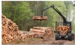
Bosbouw en natuurbeheer