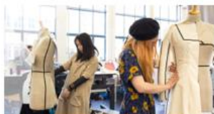
Mode en kleding