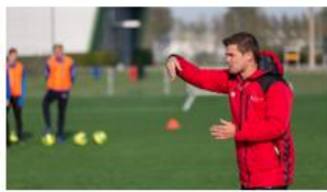
Sport en bewegen