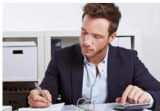
Finance en Control