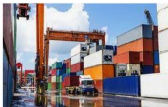
Economie en Logistiek