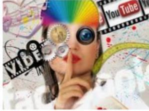
Media, kunst, reclame