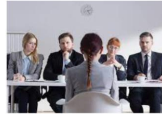
Human Resource Management

NB: Er zijn ongeveer 140 studies die je op het HBO kan doen, dit zijn enkele voorbeelden.