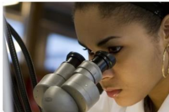
Biologie en Laboratorium